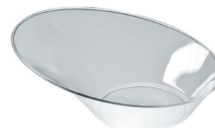
Műanyag tányér előételnek „SPRING” átmérő, 100 ml, átlátszó (art 5024)